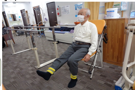
転倒予防運動(アンクルウエイト)

足首に軽い重りをつけて膝の曲げ伸ばしをする運動です。膝崩れによる転倒の予防や歩行の安定に大事なふとももの筋肉を鍛えます。イスがあれば出来る簡単な運動なので、皆様も試してください!